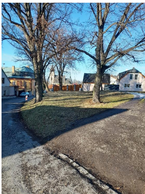
č.7 Potrubí J část, ul. U Radnice