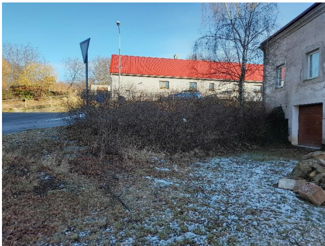
č.3 Břeh u čp. 8, ul. J. Hejzelný