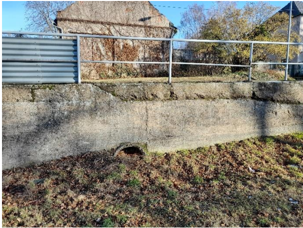
č.1 Prostup potrubí v opěrné zdi z ul. Kolínská