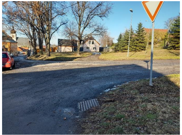
č.2 Situace terénu od ul. J.Hejzelný