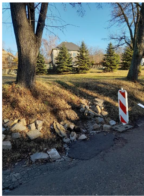
č.6 Odlehčení dešťové kanalizace, ul. U Radnice